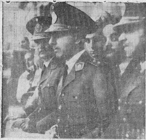
Los generales Arturo Rawson, a la izquierda, y Pedro Ramirez, al centro, jefes del movimiento revolucionario argentino que derrocó el régimen de neutralidad del presidente Castillo. Los dos líderes aparecen aquí asomados al balcón del palacio de gobierno de Buenos Aires mientras son aclamados por una enorme muchedumbre.